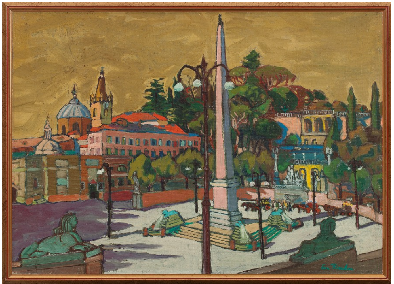
"Piazza del Popolo" – olio su tela – anno 1949 – cm. 54x73